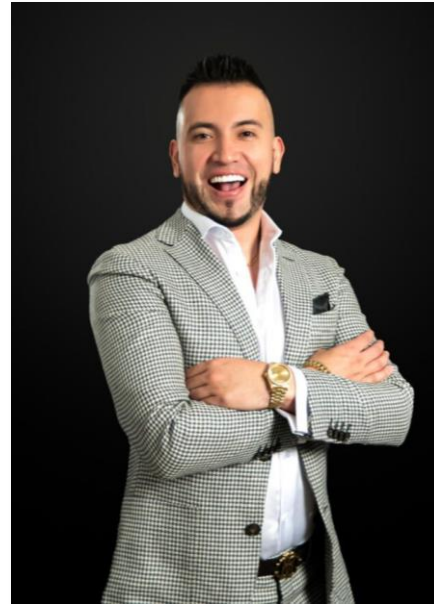
GUSTAVO SALINAS THE AMERICAN REPORTER